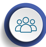
Condición de pobreza