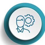
Jóvenes (18 a 29 años)